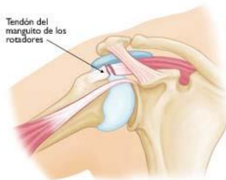
Un desgarro completo del tendón del manguito de los rotadores.