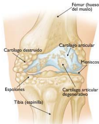
Espacio articular reducido debido al cartilago dañado y espolones