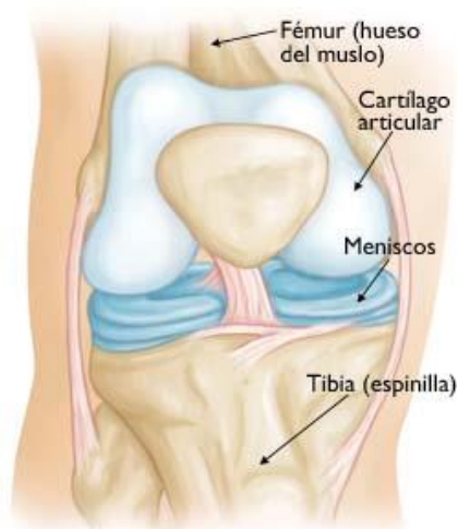
Una rodilla sana

El dolor y la rigidez son los síntomas más frecuentes de la osteoartritis de rodilla. En general, los síntomas empeoran por la mañana o luego de un período de inactividad.