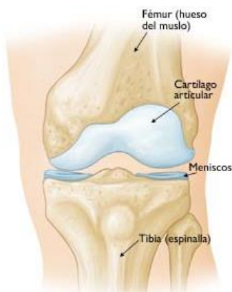
Espacio articular normal entre el fémur y la tibia

Después de analizar sus síntomas y antecedentes médicos, se puede indicarle radiografías para confirmar la presencia de osteoartritis. Las radiografías muestran si el daño al cartilago ha reducido el espacio articular que separa los huesos de la rodilla.